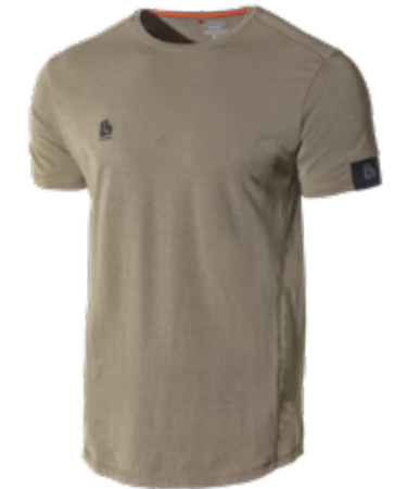
6030BV MOMENTUM KHAKI