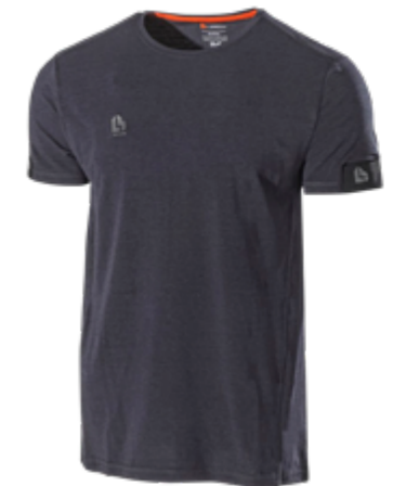
6030BV MOMENTUM MARIINI