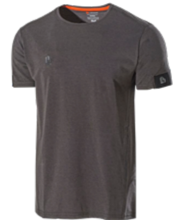
6030BV MOMENTUM HARMAA